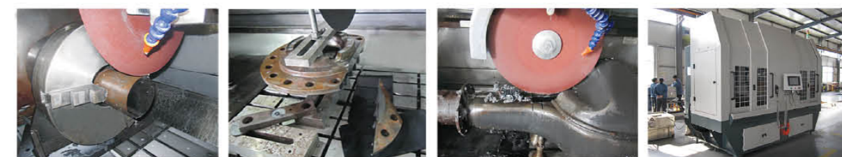
世界首台大型汽车部件试样切割机（湖北二汽集团订做）